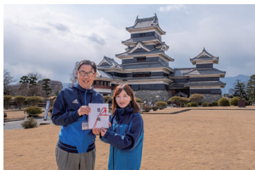
寄付金贈呈式の様子

令和8年1月から2月の金・土曜に「国宝松本城天守ナイトツアー」を実施し、国内外から計142名にご参加いただきました。