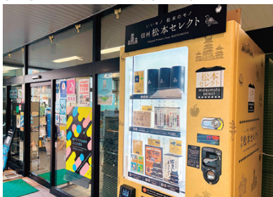
土産物自動販売機

松本市観光情報センター屋外に、24時間利用できる土産物自動販売機「松本セレクト」を本年1月に設置しました。時間を気にせず購入できる環境を整えることで、旅行者の利便性向上に加え、従来取りこぼしやすかった“早朝・夜間”の購買機会の創出を図っています。