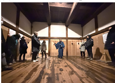
ナイトツアーの様子

冬季の観光閑散期における誘客施策として実施している「国宝松本城ナイトツアー付き宿泊プラン」は、本年度で5年目を迎えました。昼間とは表情を変える“夜の松本城”を、冬季ならではの特別演出とともに体感していただく企画で、宿泊と組み合わせることで滞在価値の向上を目指しています。