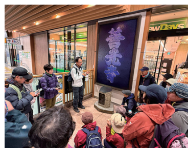
JR長野駅で丁石の起点の説明を受ける様子

2年余りで全7回、多くの参加者の皆様と約80キロを踏破し、洗馬宿から善光寺までの街道を歩き切りました。