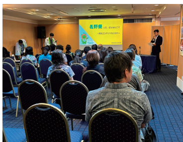
沖縄商談会の様子

11月4日(火)、沖縄県那覇市で開催された「長野県観光説明会・商談会in 沖縄」（一般社団法人長野県観光機構主催）に参加しました。