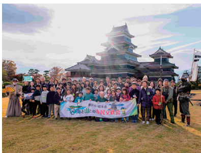
松本城歓迎会の様子

11月1日(土)～3日(月・祝)の3日間、姉妹都市である藤沢市から親子10組23名を松本市に迎え、上高地散策、乗鞍高原での星空観察、今井地区でのりんご狩り体験など、松本の自然と文化を満喫できるプログラムを実施しました。