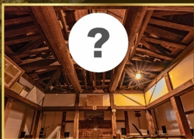
⑥ 二十六夜神(天守6階)