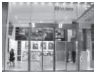
T I C 東京 外観